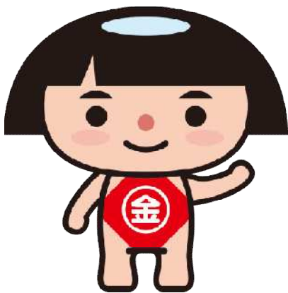
神奈川県PRキャラクター かながわキンタロウ